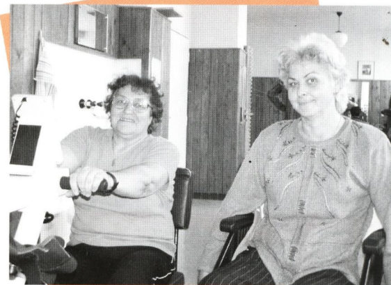
Klientky komunitných služieb DSS Gaudeámus

Základnou zásadou komunitných služieb je, že ľudia s postihnutím, resp. ľudia so špeciálnymi potrebami, ale aj ich rodinní príslušníci a ostatní členovia komunity preberajú na seba aktívnu úlohu.