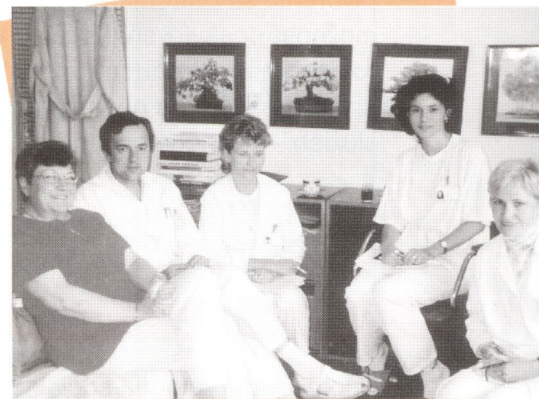
Členovia tímu kliniky FBLR s kanadskou expertkou

V ďalšej fáze pokračovali členovia tímu vo výjazdoch, nadväzovali nové kontakty, postupne spracúvali jednotlivé dotazníky a monitorovali potreby klientov po ukončení liečby v zdravotníckom zariadení.