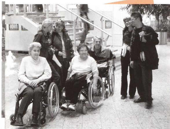
Návšteva nákupného centra s klientkami komunitných služieb