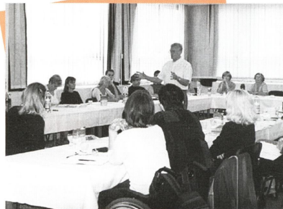
Kanadský expert počas odbornej prednášky účastníkom projektu

4. Organizovanie pracovných stretnutí na medzinárodnej, národnej a regionálnej úrovni, zameraných na zvyšovanie povedomia verejnosti v otázkach ľudí s postihnutím.