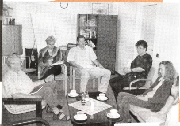
Diskusia účastníkov projektu počas vzdelávacieho modulu

Na základe uvedeného tak možno konštatovať, že prostredníctvom pripravovaných legislatívnych zmien sa vytvára vhodné právne prostredie na rozvoj a poskytovanie komunitných služieb aj na Slovensku.