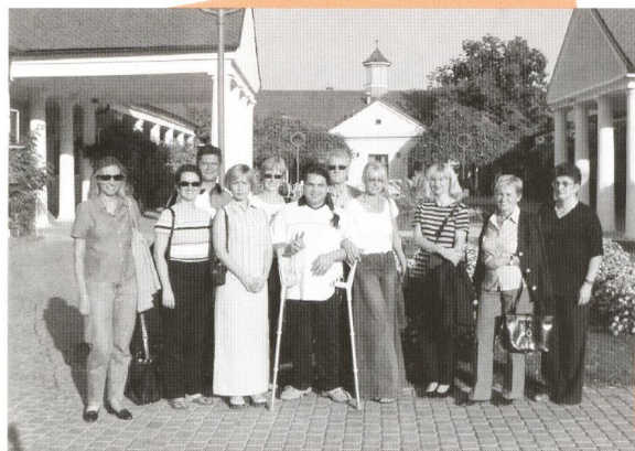
Niektorí účastníci kanadského projektu počas vzdelávacieho modulu v Piešťanoch

Zámerom projektu je tak rozvinúť kapacitu na národnej, regionálnej a miestnej úrovni, a to v záujme podpory rozvoja politiky miestneho partnerstva medzi zainteresovanými rezortmi, medzi verejnou, štátnou a súkromnou sférou.