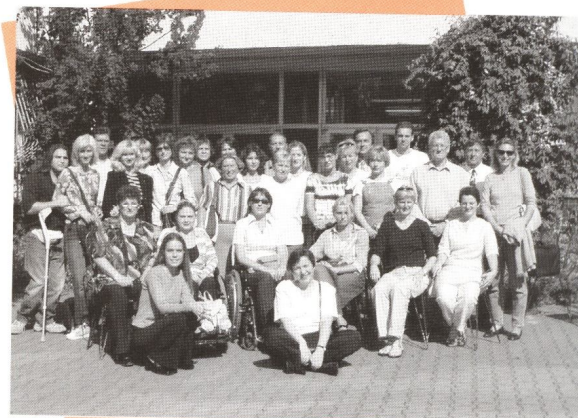
Účastníci kanadského projektu počas vzdelávacieho modulu v Piešťanoch